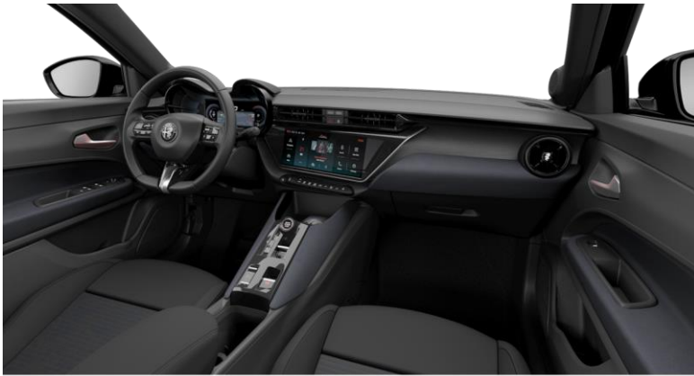
CORE: opc. 033