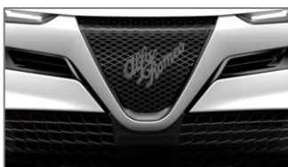
Prednja maska - Scudetto Legend