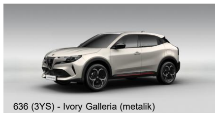
636 (3YS) - Ivory Galleria (metalik)