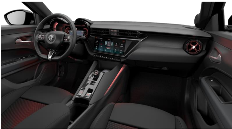
SPECIALE in VELOCE: opc. 070