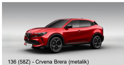
136 (58Z) - Crvena Brera (metalik)