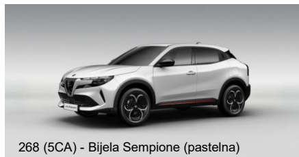
268 (5CA) - Bijela Sempione (pastelna)