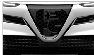
Prednja maska - Scudetto Progresso

Zadržavamo pravo promjene cijena, opreme i tehničkih podataka u bilo koje vrijeme i bez prethodne najave. O veznom zadnjem stanju pitajte svog trgovca.