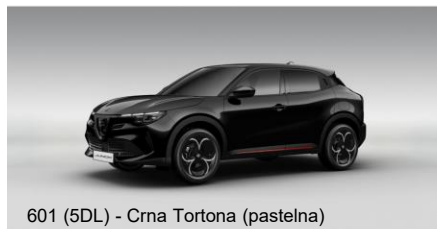
601 (5DL) - Crna Tortona (pastelna)