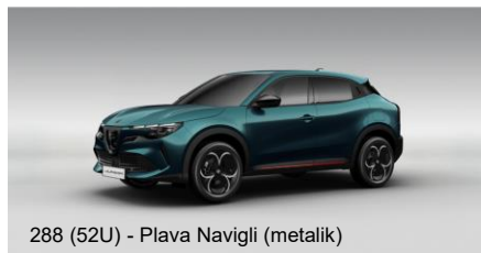
288 (52U) - Plava Navigli (metalik)