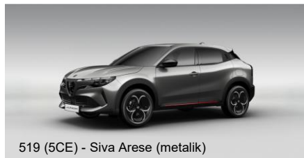
519 (5CE) - Siva Arese (metalik)