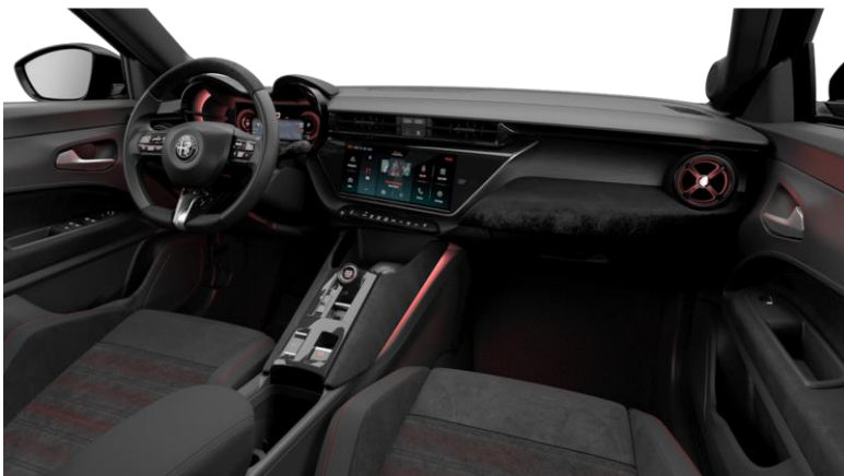
Dodatna oprema - SPECIALE in VELOCE: opc. 824 / 878